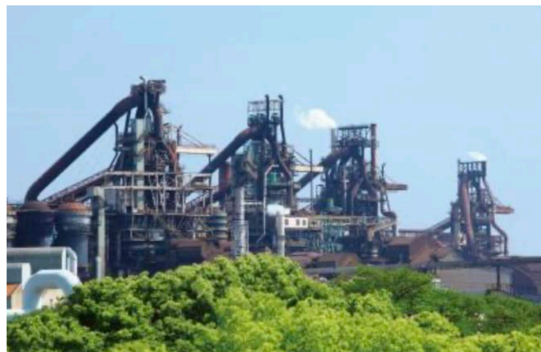
JFEスチール株式会社 西日本製作所（福山地区）